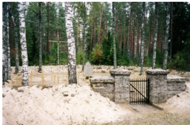
Deutscher Soldatenfriedhof 1914/18